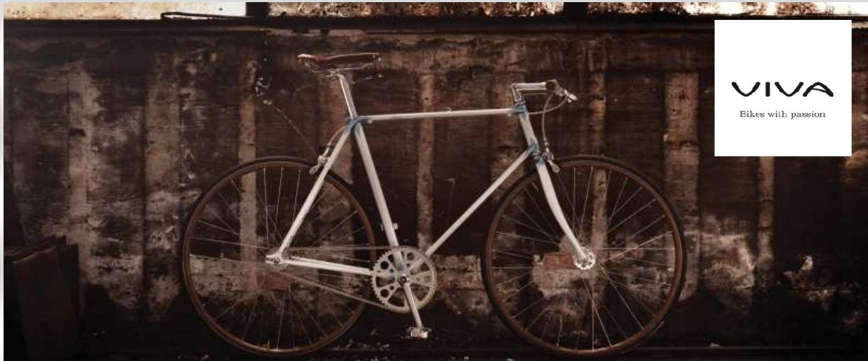
And the Winner is: VIVA Duro

~ Die Jury des EUROBIKE Awards ist sich einig: Klarheit und Simplizität des Designs sind in der Kategorie „Cruiser/Designbike“ herausragend ~